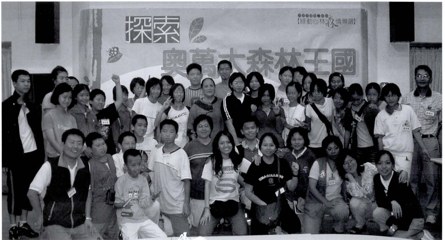
◆奧萬大生態研習營，培訓種子教師推展旅遊新觀念。

園化、以及「森林資源保育與森林遊樂」之專業化。配合政府所持續推動之「觀光客倍增計畫」，宣傳與行銷台灣、吸引更多外國人士來台觀光是其中的重點工作，然而深度介紹台灣森林遊憩資源的外文出版品卻是少之又少，往往造成許多行銷的阻礙；有鑑於此，出版英文