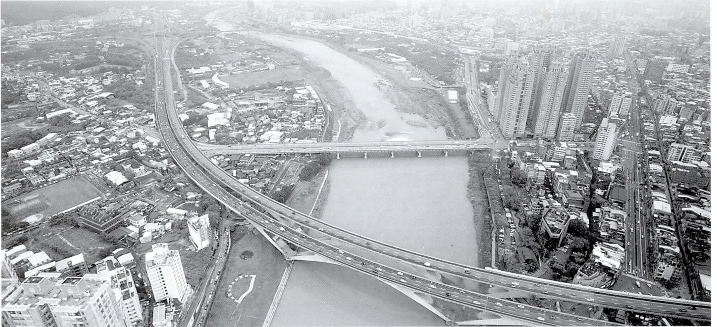
◆大漢溪上游宛延的溪頸匯聚向下注入淡水河。

墾拓的文化為主軸，在龍潭客家拓墾文化風貌營造及大溪河階聚落文化風貌營造；另外，中下游河段的特色產業發展更是大漢溪的特色之一，舉例來說，鶯歌陶瓷產業文化景觀及三峽藍染體驗經濟，由主題性的特色風貌營造，建立起大漢溪獨特性及自明性高的景觀風貌。