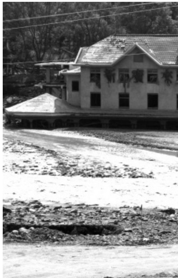
◆莫拉克颱風後的新寶來度假村，

基金會以前最大的優勢是有平面媒體—中國時報和中時晚報，可以將各種活動的目的或理念，廣泛而有效地宣揚出去，可有效地促進國人環保觀念。這方面基金會的貢獻很大，以前台灣很窮，大部分的人每天起床就是