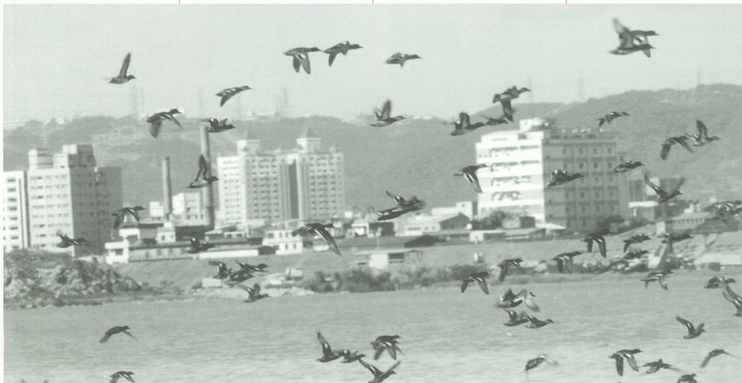
◆淡水河經過整治之後，也是最佳賞鳥場所。