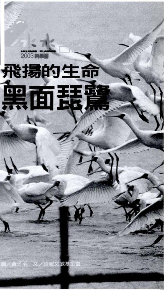
飛揚的生命 黑面琵鷺