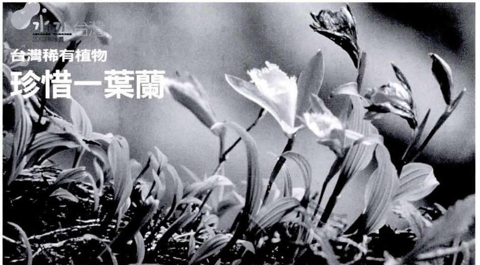
台灣稀有植物 珍惜一葉蘭