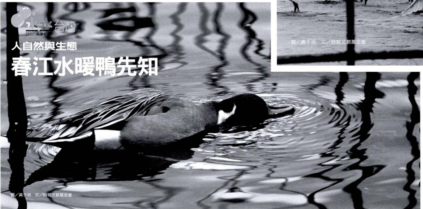
人自然與生態 春江水暖鴨先知