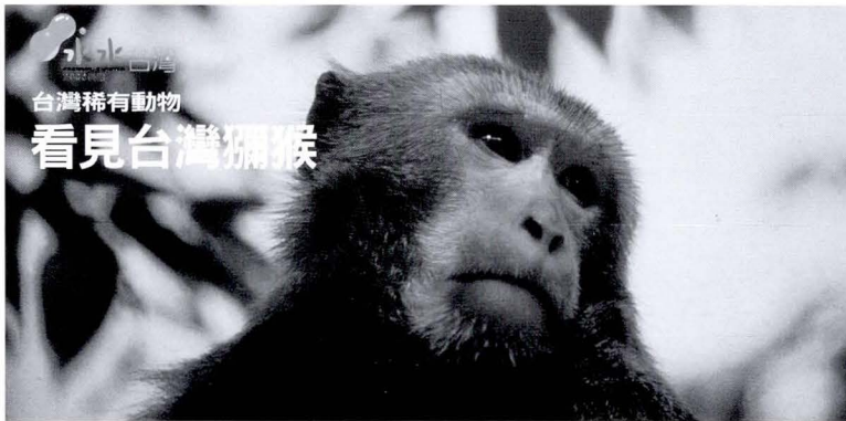
台灣稀有動物 看見台灣獼猴