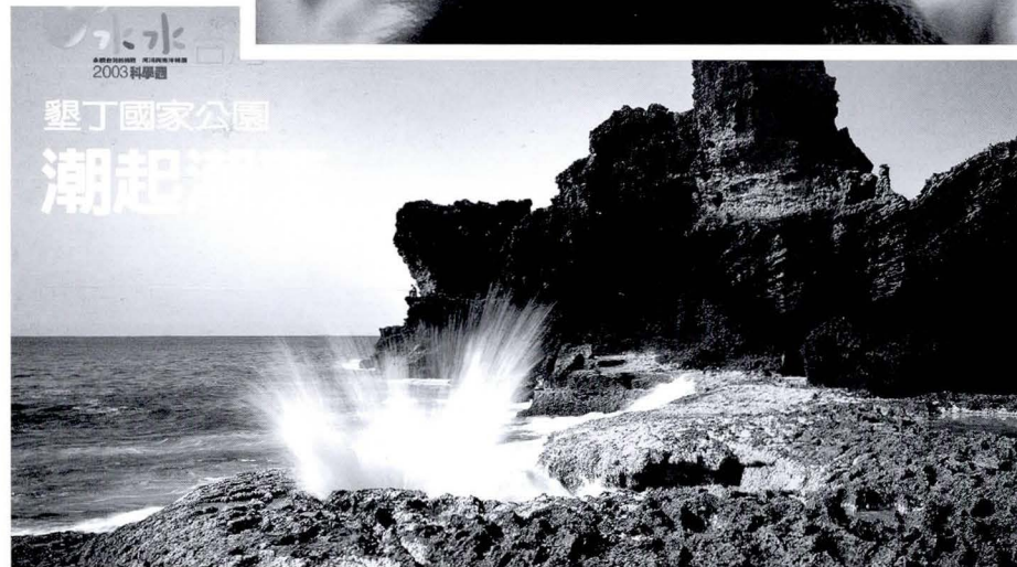
墾丁國家公園 潮起潮落