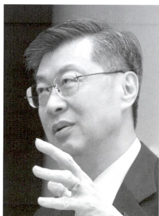
◆陳沖/合作金庫銀行董事長