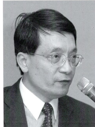
◆ 李桐豪 / 立法委員