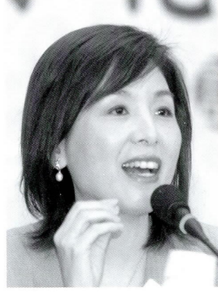
◆ 李紀珠 / 立法委員