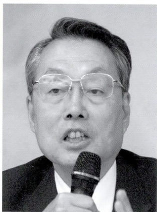
◆施振榮 / 智榮基金會董事長

當 台灣社會原有的倫理教養，隨著政治與社會的變遷快速式微時，輿論該如何在現實社會中發揮影響力，並思考國家未來的方向？時報文教基金會為鑑於此，特舉辦《面對公與義、思考大未來：重建台灣社會的核心價值》座談會，就個人價值、倫理教養、專業典範、公共領域及民主理念五個面向進行相關探討。