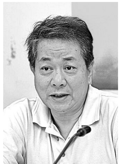
◆河川環境小組於幼華顧問。