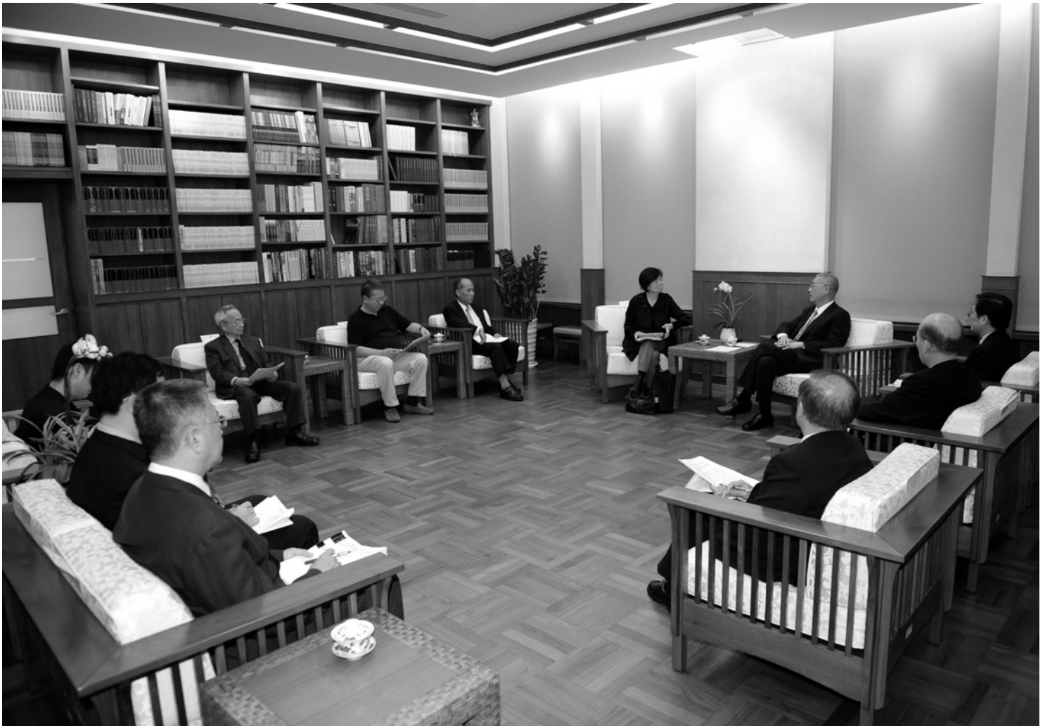
◆余紀忠文教基金會會同各方專家學者前往拜會行政院吳敦義院長。

課題二：針對上述三大危機，六都於升格之後，應有什麼不同的作為？中央地方的權責劃分應如何重新界定？