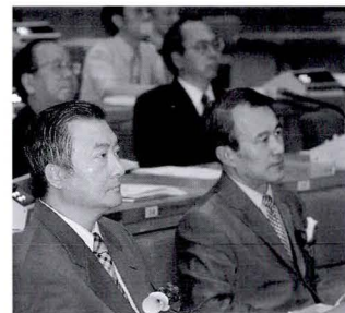
◆法務部長陳定南（右下）願意勳行環保掃黑。