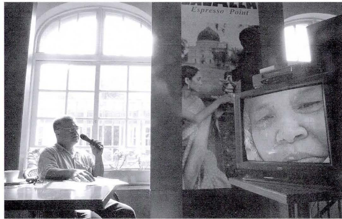
◆胡德夫唱出原住民的心聲。

基金會執行長余小姐也到場參與了這次的授旗典禮，隨後並與陳總統一起砍下一棵檳榔樹，並親手種下一株原生無患子樹種。她表示基金會投入這個活動，並不是錦上添花，完全是因為村民自立、自信、自發、時報的投入只是殆盡外界的力量，協助他們，余小姐希望基金會率先站出來，也期望各界人士能一起來支持這項活