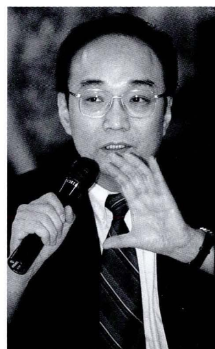
◆王汎森推動科技與人文的對談。

出，和過去國內類似主題的演講不同的是，這次演講系列既不偏重科學知識的介紹，也不集中於人文的反省與批判，而是兩者兼備；會中邀集國內人文社會學者以及相關領域的科學家，共同合作，針對特定的基因科技人文議題，進行主題演講與後續座談，使最精闢的人文反省確實能建立在對於科學最新發展的認知之上。