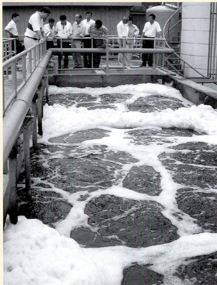
◆污水若處理得當，對環境和水媒疾病之控管有很大助益。

都市土地、接管等老問題如何解決，可能有其他的替代方案例如截流應是可行的。另外，在社區裡，應可採地面壓力式的管線，接到外面的污水處理場。三、五十年代的建設是為了下一代，今天普及率只有10%，但也不能太急，應