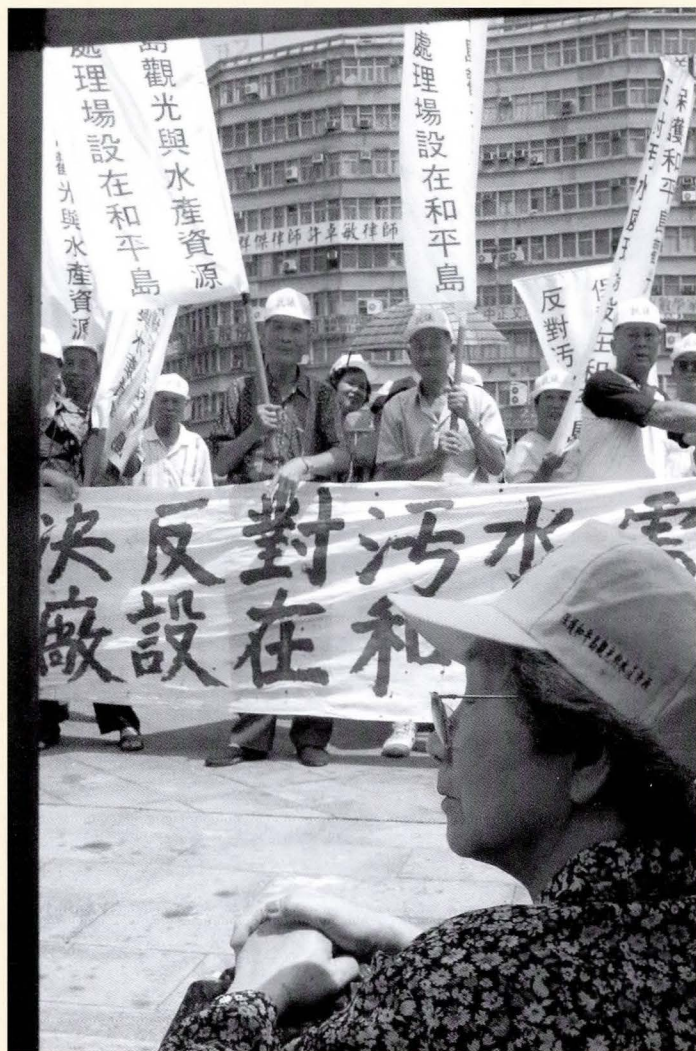
◆污水處理考驗政府與民眾的智慧。

建設經費也要花不少錢，如果政府交給民間來做，前三年污水處理廠的建設經費由政府負責，三年後接下來的主幹管線或小部份的管線由民間負責，整個系統