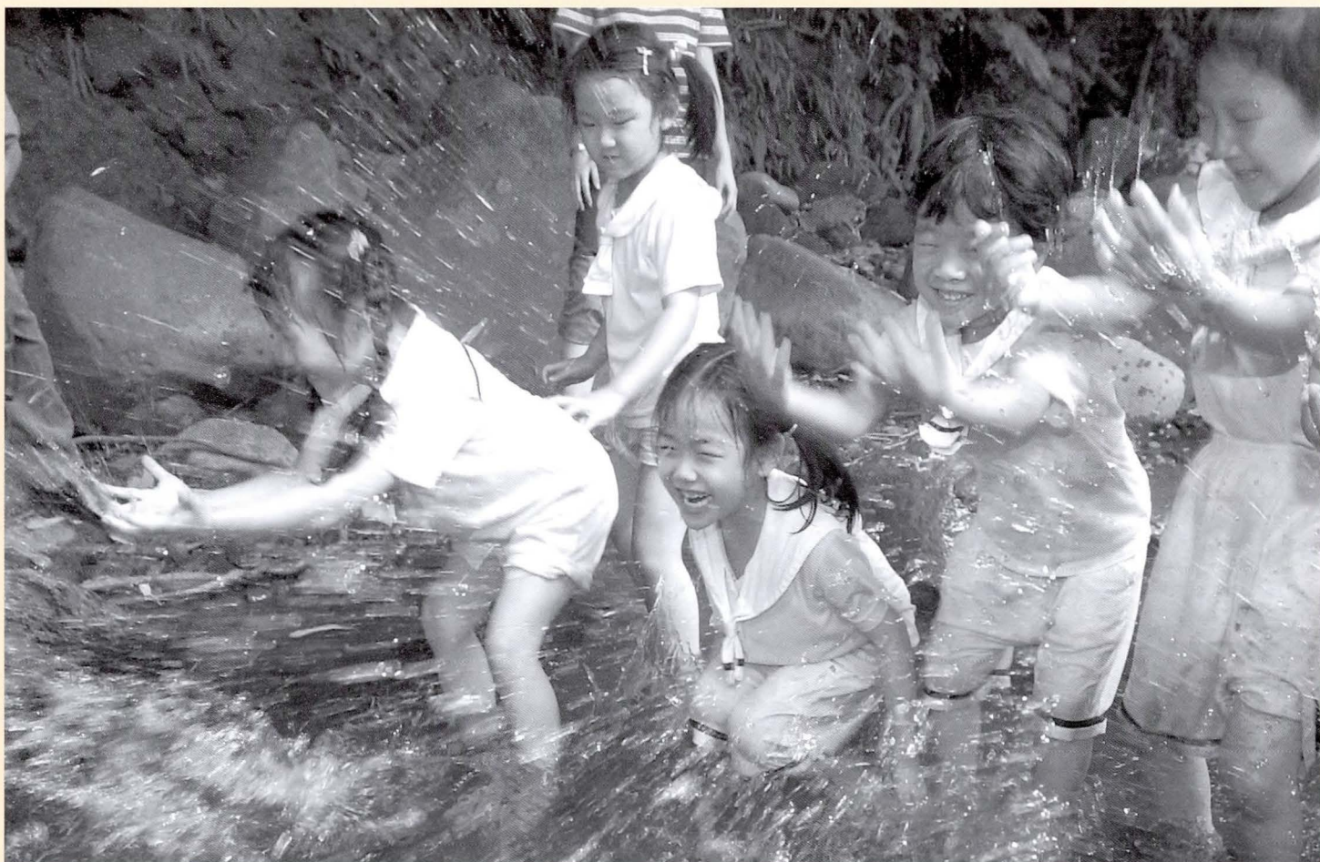
◆下水道建設攸關河川品質，親水政策必須正視下水道議題。